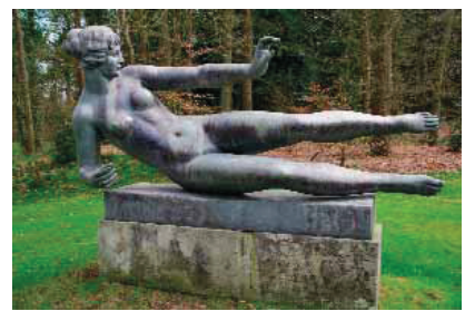
Tekst en foto's: John De Vlieger

Voor info en meer tips in de regio: Regionaal Bureau voor Toerisme Arnhem Nijmegen BV E-mail: info@rbtkan.nl www.regioarnhemnijmegen.nl