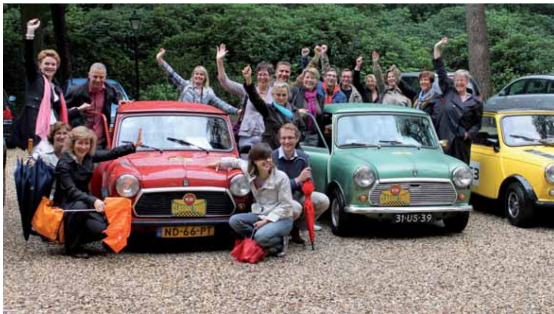
“Kennismakingsweekend voor Belgische meetingplanners”