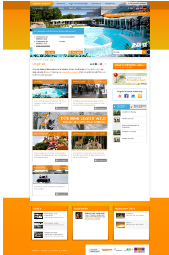
Pagina: Dagje uit