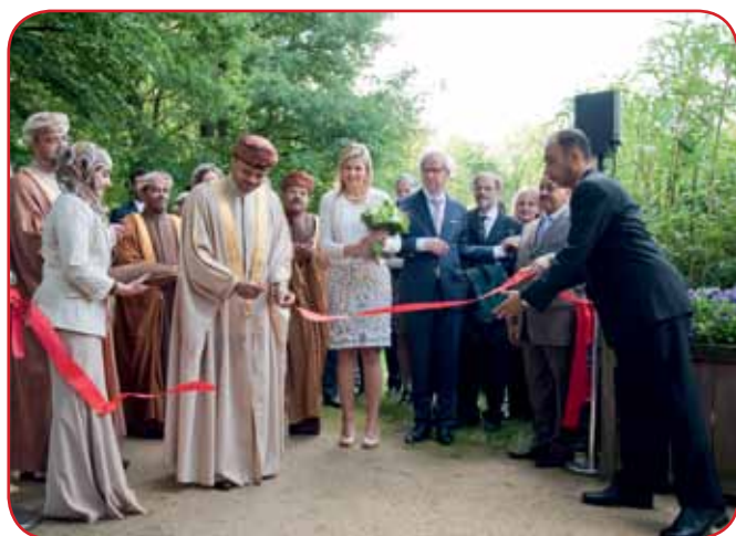
Prinses Máxima bij heropening van Museumpark Orientalis