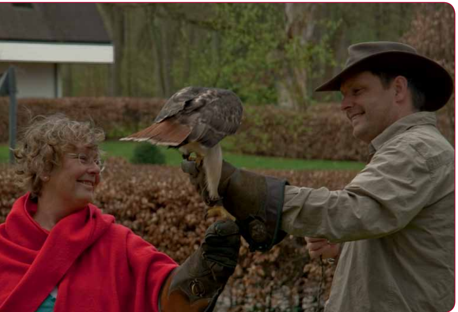
Exploring Emotion op relatie evenement Convention Bureau