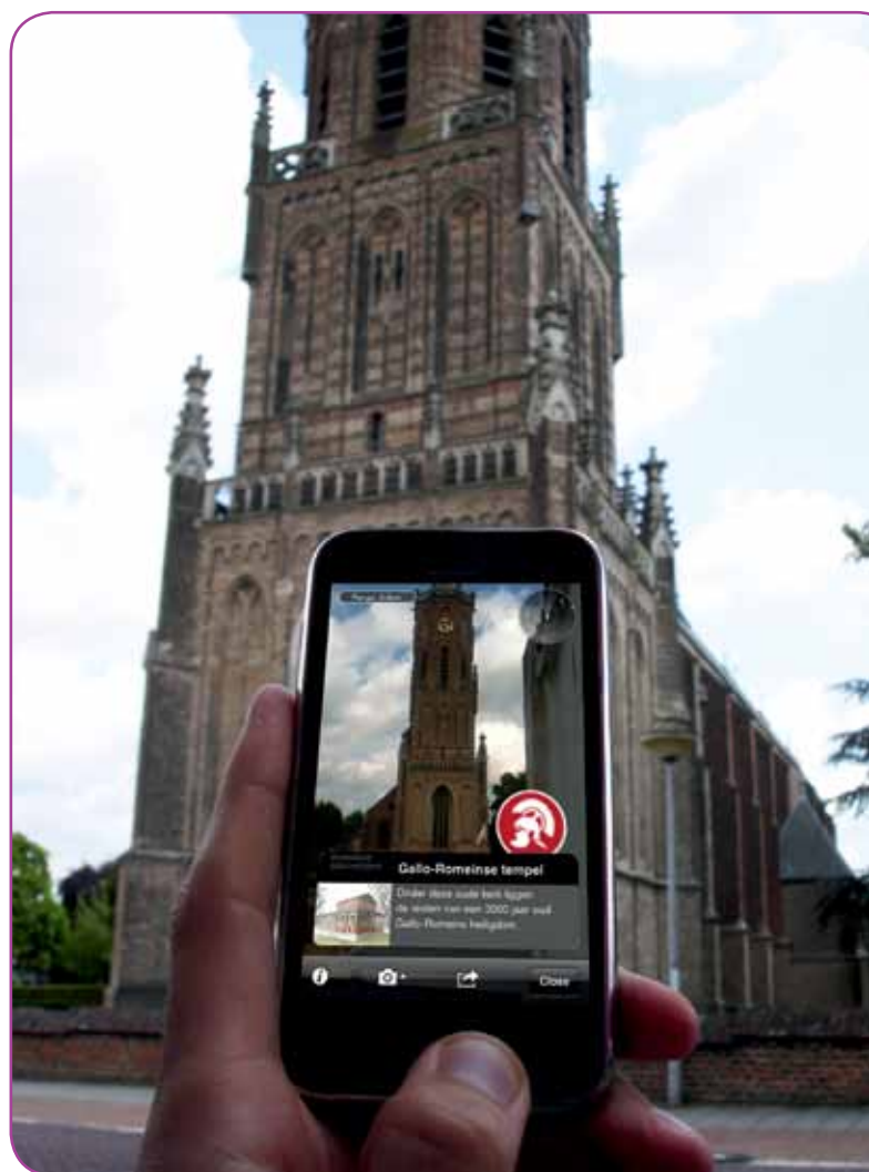
Applicatie Layar Spannende Geschiedenis

Op 24 juni 2010 is in Nijmegen een pilot gestart om door middel van augmented reality (toegevoegde realiteit) historische informatie op een nieuwe manier te ontsluiten. Via de applicatie 'Layar' worden, door gebruik te maken van de camera en het GPS-signaal, historische punten getoond op de mobiele telefoon waarover meer informatie wordt gegeven. Nu, een jaar later, zijn alle 87 locaties van het Historisch Belevings Netwerk opgenomen in de Layar. Via Layar wordt op deze locaties meer informatie gegeven over de Romeinen, Middeleeuwen en de Liberation Route. Dit wordt ondersteund door historisch beeldmateriaal, video's en audioverhalen.