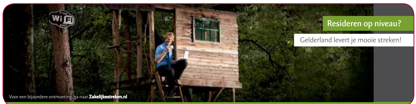
Gelderse Streken advertentie

Komende zomerperiode zal de caravan wederom door het land trekken om diverse decisionmakers te trakteren op een lunch.