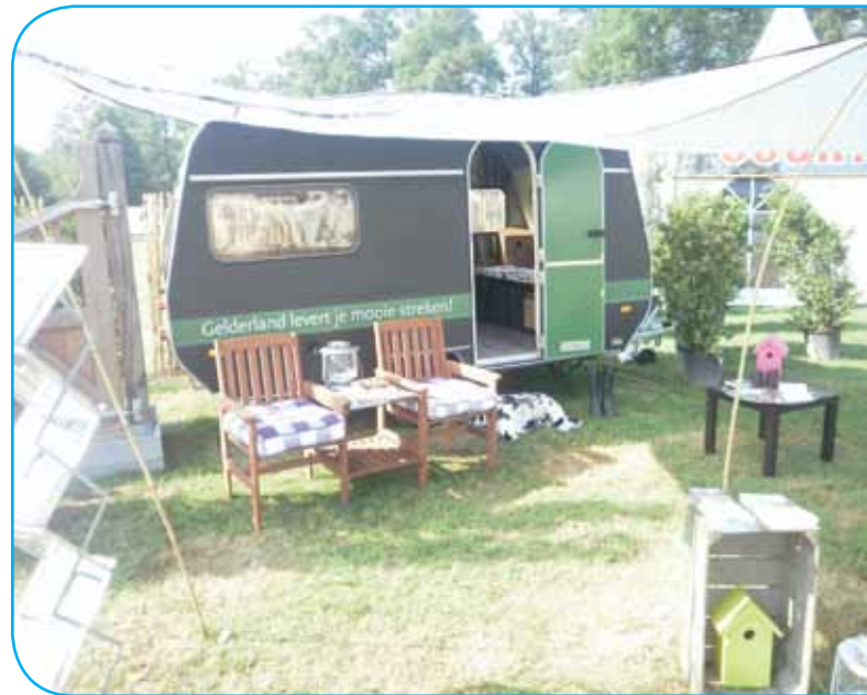
Stand Outdoor Gelderland

RBT KAN stond dit jaar met de Gelderland promotiecaravan op de fair van Outdoor Gelderland. Outdoor Gelderland is een paardensportevenement en vindt plaats op Landgoed Middachten in de Steeg van woensdag 8 tot en met maandag 13 juni. De Gelderland promotiecaravan fungeerde als stand waarbij de bezoekers informatie konden krijgen over fietsen, wandelen, paardrijden, cultuur etc.