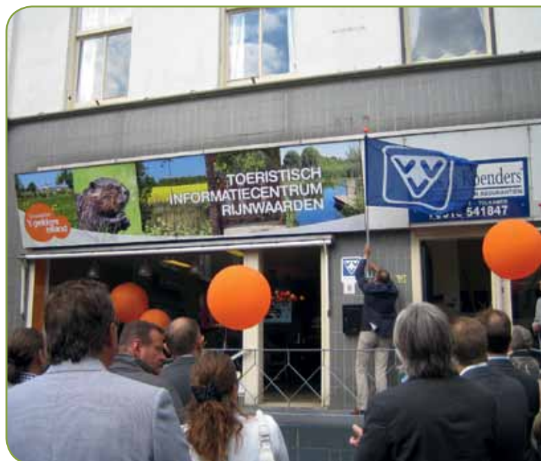
Opening Toeristisch Informatiecentrum Rijnwaarden

Het toeristisch informatiecentrum is het begin van nog meer activiteiten in deze gemeente. De betrokken partijen zijn van plan om meer samenhang in alle inspanningen op het gebied van recreatie en toerisme te krijgen. Het toeristisch informatiecentrum is gehuisvest aan de Rijnstraat 18 in Tolkamer.