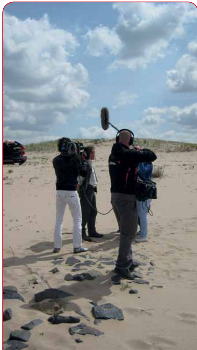
Lekker weg aan tafel, opnames in de Gelderse Poort

Voor de communicatiecampagne plattelandstoerisme Nationaal Landschap de Gelderse Poort is de afgelopen maanden een flink aantal activiteiten uitgevoerd ter promotie van de regio. Een onderdeel van de campagne was een Gelderse Poort uitzending van de televisieserie 'Lekker weg aan tafel' op RTL4. In het programma worden de kijkers door Evelyn Struik en René Pluijm geïnspireerd om eens wat vaker het eigen land te ontdekken. Gedurende de uitzending ontdekt de familie samen met de presentatrice de regio. Ondertussen bereidt René Pluijm een diner voor met typische streekgerechten. Op 5 juni stond de aflevering in het teken van de Gelderse Poort. De 145.000 kijkers kregen in een half uur een duidelijk beeld van de vele sportieve, culturele en culinaire mogelijkheden in de Gelderse Poort. Er werd o.a. een munt geslagen in Millingen aan de Rijn, er werd getrommeld in het Afrika Museum en natuurlijk werd er vlees gegeten afkomstig uit de Gelderse Poort en brachten ze een bezoek aan fruitwinkel de Woerd. Ook zijn ze gaan struinen door de Ooijpolder (inclusief een ontmoeting met de Konikpaarden en Gallowayrunderen in de Gelderse Poort). De gemiste aflevering is terug te zien via rtlgemist.nl .